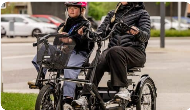
Električni paralelni tandem DUO REHA

V CUDV Radovljica skrbimo za otroke in odrasle z motnjami v duševnem in telesnem razvoju. Mnogi med njimi klasičnega kolesa ne morejo uporabljati – zaradi ravnotežja, moči ali gibalnih omejitev. Električni paralelni tandem DUO REHA to spreminja: uporabnik in spremljevalec sedita drug ob drugem, vsak poganja po svojih močeh, tandem pa jima pomaga z električnim pogonom. Ni zgolj kolo – je svoboda, terapija in druženje v enem.